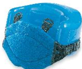
Крепление для бедер