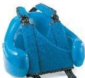
Крепление для туловища