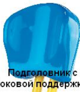
Подголовник с боковой поддержкой

Модульные подушечки и рама включены в комплект каждой модели, а также поставляются отдельно. Есть большой размер для Тристендера 58 и маленький - для Тристендера 45. Регулируемые модульные подушечки