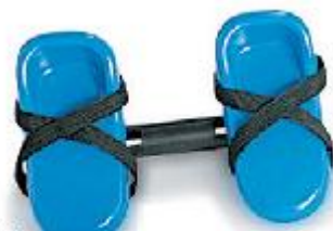
Крепление для стоп с перекладиной