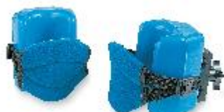
Крепление для коленей