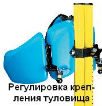
Регулировка крепления туловища